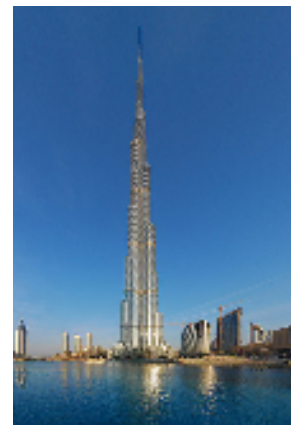
ブルジュ・カリファ(世界最高層ビル)(高耐候性粉体塗料)