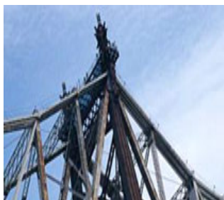
パリ・エッフェル塔(重防食塗料)